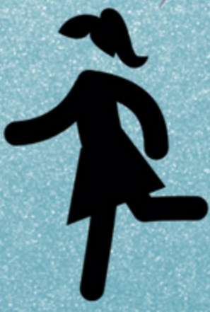
Integrante del CEPCI

Defenderé y promoveré el respeto a la ética, a la integridad y a las reglas de integridad